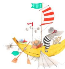
Illustration Helga Bansch