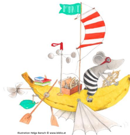
Illustration Helga Bansch © www.biblio.at