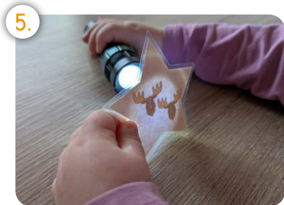
Beleuchte die Kärtchen von hinten mit einer Taschenlampe! Was siehst du?