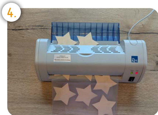
Laminieren die Kärtchen zur besseren Haltbarkeit!