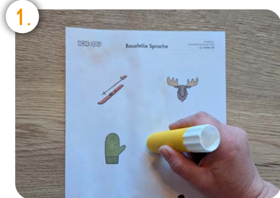
Bestreiche die Vorderseite von Blatt 4 mit Kleber!