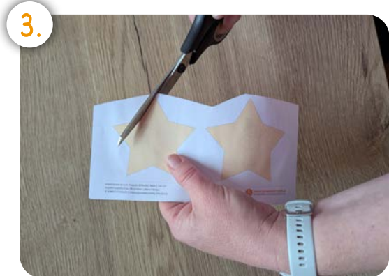
Schneide die Kärtchen aus!